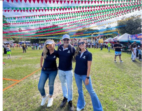
Evidencia de la actividad (6)