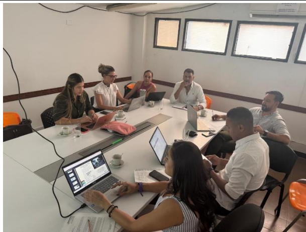
Evidencia de la actividad (3)

Participé en mesa de trabajo virtual con la Federación Colombiana de para atletismo para revisión del apoyo que brindo la Secretaria del Deporte al evento gran Prix de para atletismo que se desarrolló en el Distrito de Santiago de Cali.